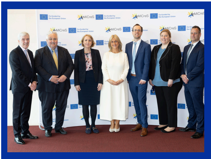
Frankfurt School e IOB Team

Maggiori informazioni: https://iob.ie/news/iob-hosts-european-launch-of-innovative-micres-project